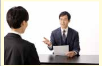
掲載写真はイメージです。

担当講師・担当者がアドバイス 模擬面接訓練 ★ 納得いくまで面接準備が行えます。