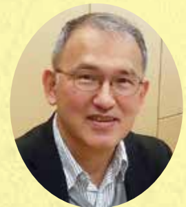
京大大学生協同組合 理事長 (京都大学 教員)

公務員を志望されている方、進路の一つに考えている方はもちろん、公務員について知りたいという方もぜひ同封のパンフレットをご覧ください、ガイダンスにご参加ください。