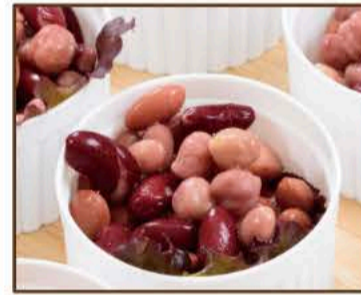
ミックスビーンズのマリネ