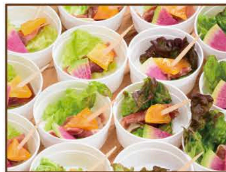
生ハムとドライフルーツのピンチョス