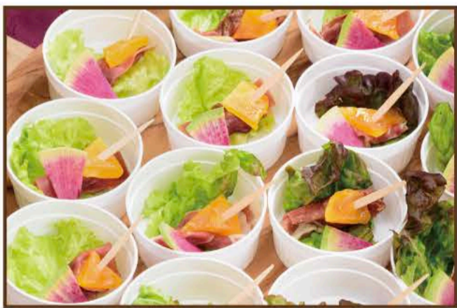
生ハムとドライフルーツのピンチョス