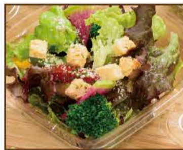
カップサラダ ~シーザードレッシング~