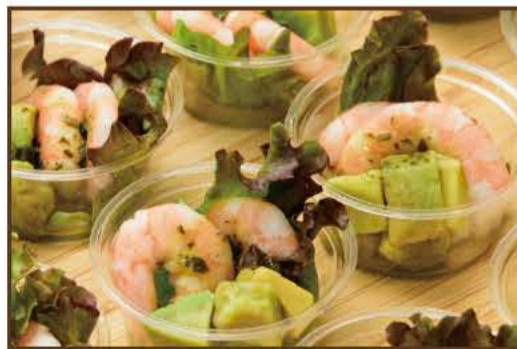
アボカドとエビのバジリコマリネ