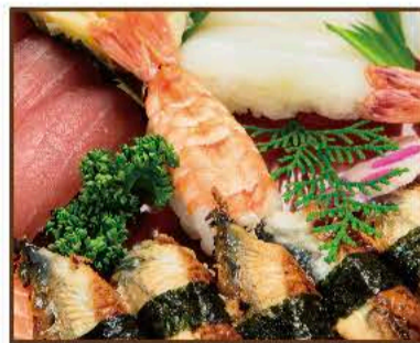
握り寿司盛り合わせ