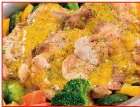
鶏もも肉のグリル～彩り野菜添え～