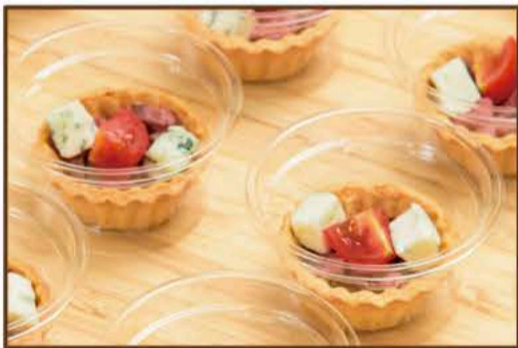
ローストビーフとブルーチーズのタルト