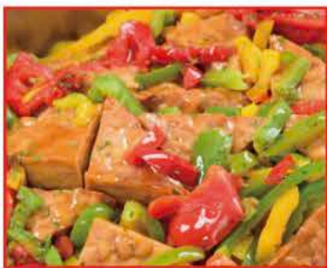
テンペのゲリル ~甘酢中華餡掛け~