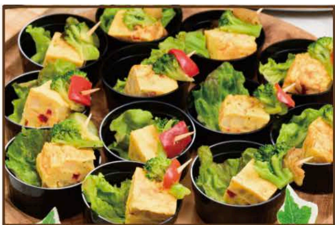
季節のフィンガーフード