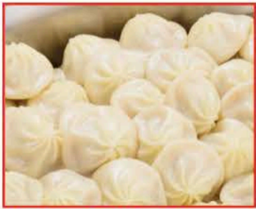
大豆ミートの小籠包