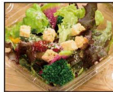
カップサラダ ~シーザードレッシング~