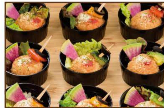
トリュフ風味のライスコロッケ