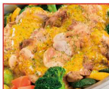
鶏もも肉のグリル ～彩り野菜添え～