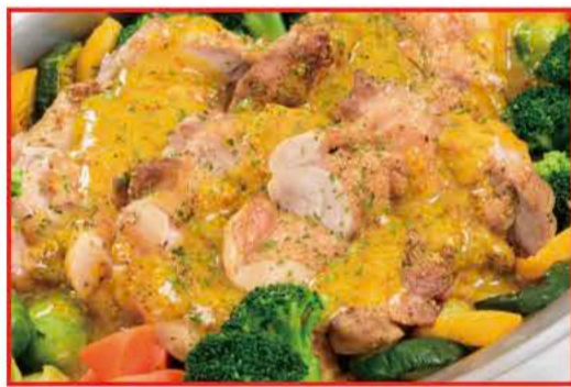
鶏もも肉のグリル〜彩り野菜添え〜