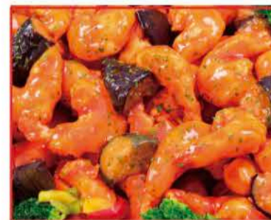
四川風エビのチリソース