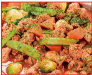
大豆ミートの菜園風トマト煮込み