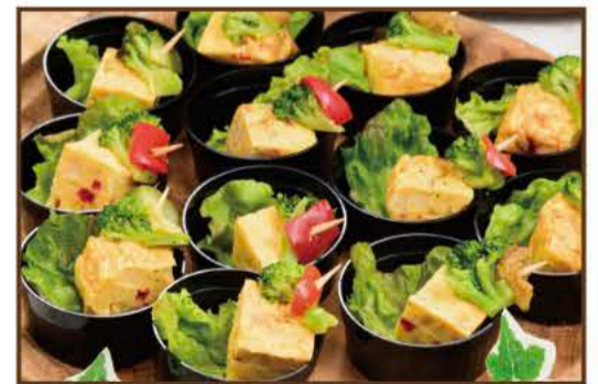
季節のフィンガーフード