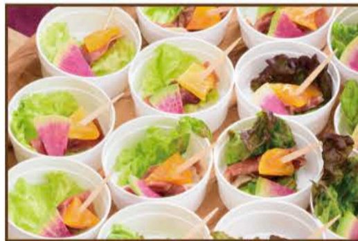
生ハムとドライフルーツのピンチョス