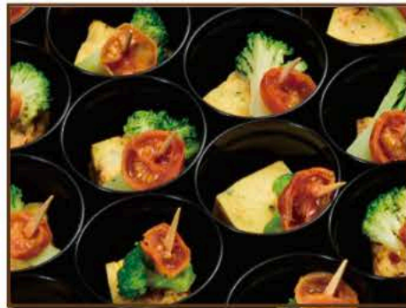
季節のフィンガーフード