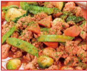
大豆ミートの菜園風トマト煮込み