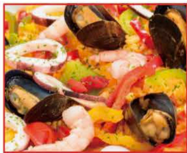
地中海風シーフードパエリア