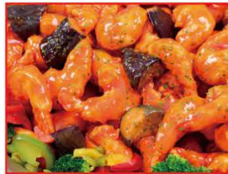
四川風エビのチリソース