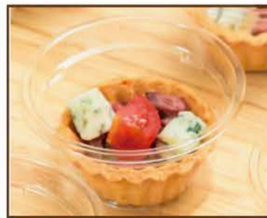
ローストビーフと ブルーチーズのタルト