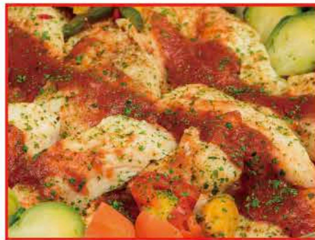
白身魚のグリル～ポモドーロソース～