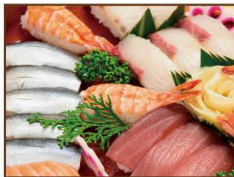
握り寿司盛り合わせ