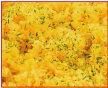
ターメリックライス