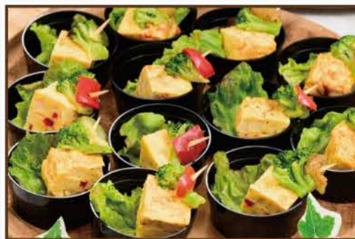
季節のフィンガーフード