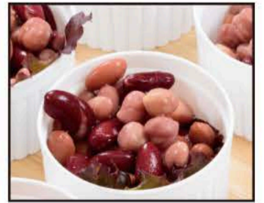
ミックスビーンズのマリネ