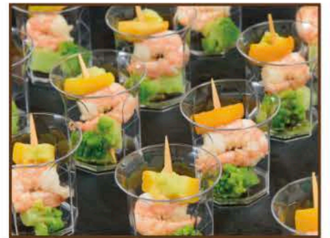
エビとロマネスコのピンチョス～バジルソース～