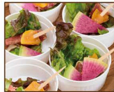
生ハムとドライフルーツの ピンチョス