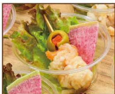
ホタテとオリーブのピンチョス