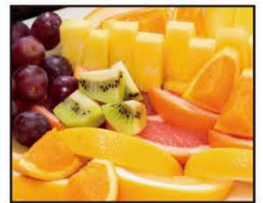
フレッシュフルーツ盛り合わせ