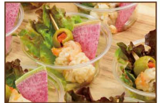
ホタテとオリーブのピンチョス