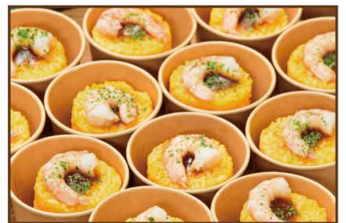
シーフードピラフ〜カップ仕立て〜