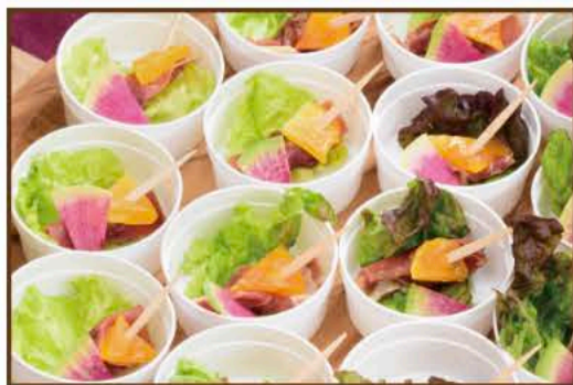
生ハムとドライフルーツのピンチョス