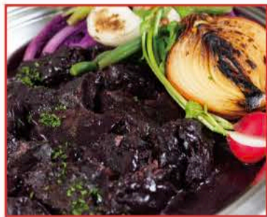
牛肉の赤ワイン煮込み