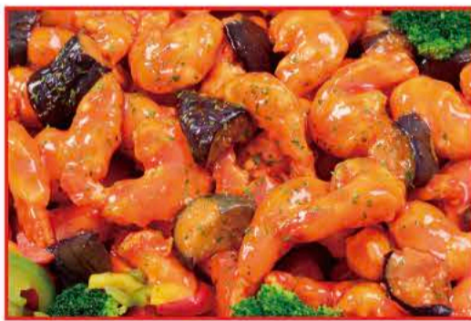
四川風エビのチリソース