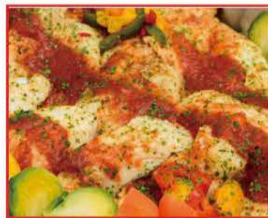
白身魚のグリル ～ポモドーロソース～