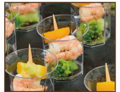
エビとロマネスコのピンチョス ～バジルソース～