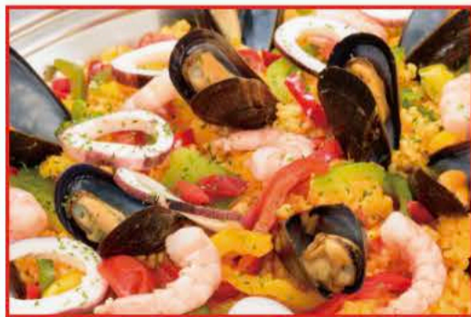
地中海風シーフードパエリア