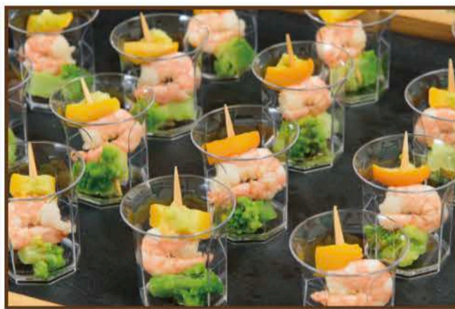
エビとロマネスコのピンチョス〜バジルソース〜