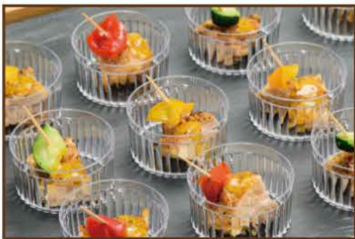
グリルチキンと彩り野菜のピンチョス