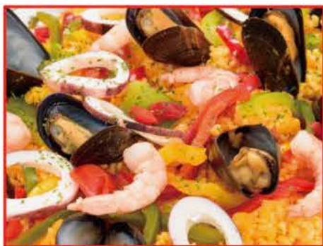
地中海風シーフードパエリア