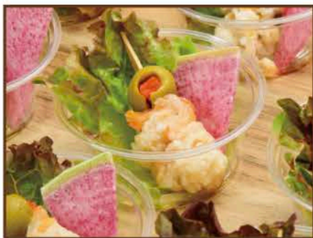
ホタテとオリーブのピンチョス