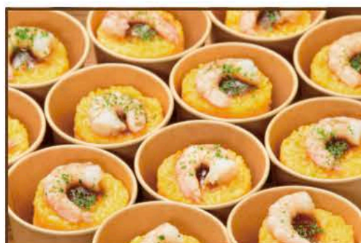
シーフードピラフ〜カップ仕立て〜