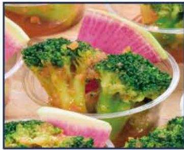
ブロッコリーのマリネ