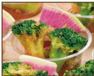
ブロッコリーのマリネ