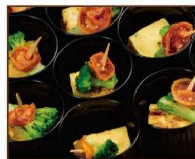
季節のフィンガーフードB