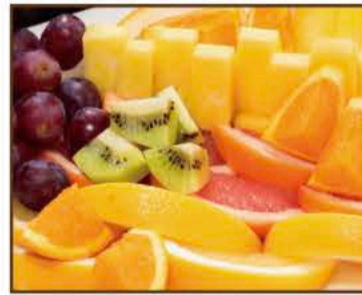
フレッシュフルーツ盛り合わせ