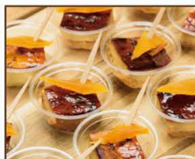
季節のフィンガーフードA