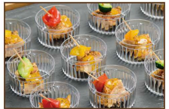
グリルチキンと彩り野菜のピンチョス