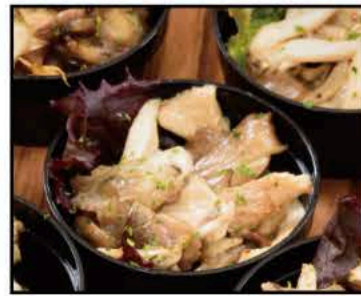
3種のキノコのマリネ