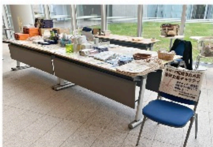
開店を待つグッズ販売

石川県令和6年能登半島地震災害義援金に募金額38,996円と、グッズ売り上げの10%となる9,449円の合計48,445円を寄付いたしました。