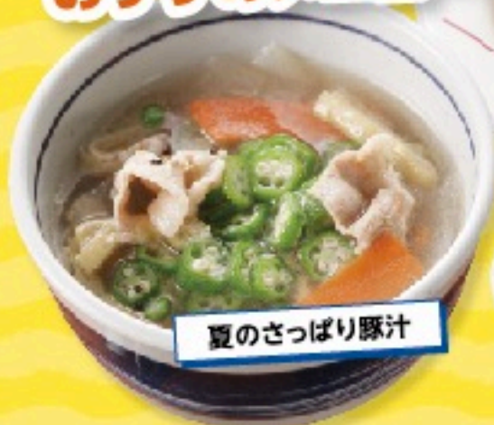
夏のさっぱり豚汁