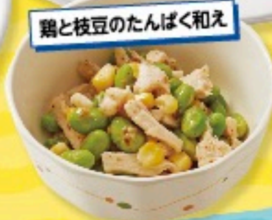
鶏と枝豆のたんぱく和え