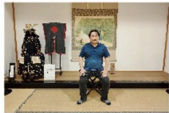
趣味のお城巡りでの一枚

京都大学生協では理事会室として、部内会議の運営から、各発行物の管理、新入生を迎える活動の取りまとめを行います。これまでの知識と経験を生かして、生協だけでなく、京都大学にも貢献できるよう尽力してまいります。よろしくお願いいたします。