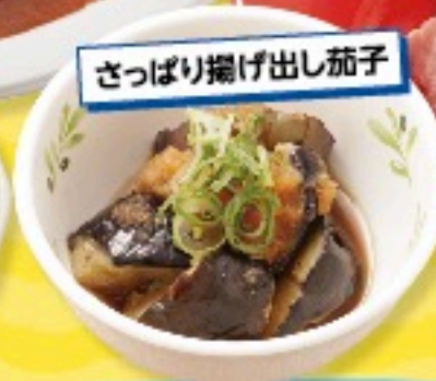
さっぱり揚げ出し茄子