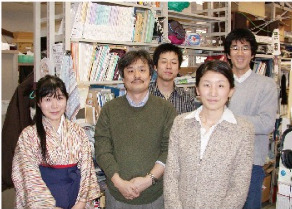
2004年3月学位授与式の日研究室で。

「どうしてここへ来たのか」、それはたぶん、どうでもよい質問だったに違いありません。しかし私にとっては、いろいろな経緯が思い起こされて、その漠然とした問いにこれという答えを出すことは不可能に思えました。私はとまどいながらも、質問の真意を確かめることもなく、咄嗟に思いつきの答えを述べて部屋を後にしたのでした。