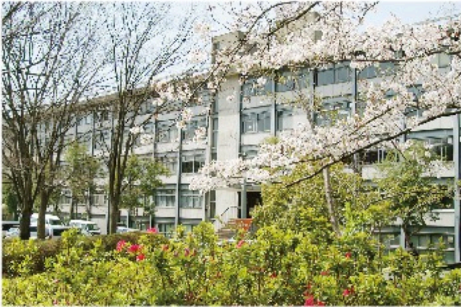
耐震改修工事前の桜の綺麗な防災研玄関の写真

昭和53年4月に京都大学防災研究所に採用され、建築系研究室、防災研究所図書室、宇治地区事務局と勤務してまいりましたが、2023年3月末をもって、京都大学を退職することとなりました。長きに渡り大変お世話になりました多くの皆様には、感謝の気持ちで一杯です。