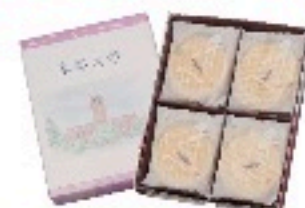
京菓子数月謹製 8枚入り