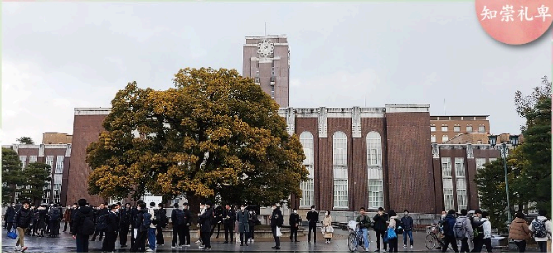
一般選抜試験日の時計台と空