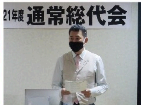
会場の座席もソーシャルディスタンスをとりました