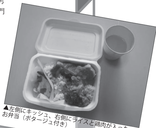
▲左側にキッシュ、右側にライスと鶏肉が入ったお弁当(ポターージュ付き)