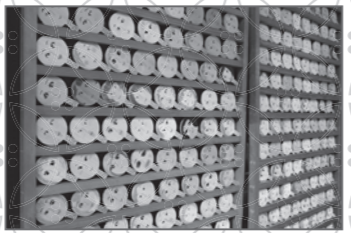
▲望みの顔が描かれた鏡絵馬

河合神社は美の神様である玉依姫命をお祀りしていることから、美人祈願の評判があります。顔が描かれた絵馬に化粧道具で自分の望む顔を描く「鏡絵馬」が有名なので、意中の相手の好みの顔になれるよう祈願してみてください。 住所 左京区下鴨泉川町59 アクセス 京都市バス停「下鴨神社前」下車徒歩5分 拝観時間 6:30~17:00 (季節によって変動あり)