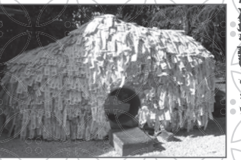
▲「縁切り・縁結びの碑」の前面

悪縁との断絶だけでなく、家族や男女にまつわる良縁にも評判の神社です。境内の「縁切り・縁結びの碑」は前から後ろにくぐると縁切りに、後ろから前にくぐると縁結びにご利益があるので、心中で願いを唱えながらくぐり抜けましょう。 住所 東山区東大路松原上ル下弁天町70 アクセス 京都市バス停「東山安井」下車徒歩3分 拝観時間 拝観自由 (授与所は9:00~17:30)