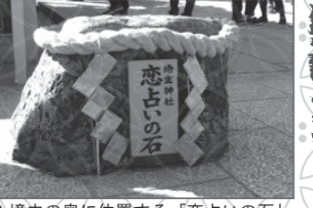
▲境内の奥に位置する「恋占いの石」

厄よけや開運、芸事上達などさまざまなご利益があり、特に京都最古のえんむすび祈願で有名です。恋の願かけ絵馬や恋占いおみくじがあるほか、境内の2つの「恋占いの石」には、目を閉じて一方から他方へ無事たり着くと願いが叶うという言い伝えがあります。 住所 東山区清水1-317 アクセス 京都市バス停「清水道」下車徒歩10分 拝観時間 9:00~17:00