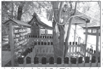
▲ご神木である連理の賢木

世界遺産としても有名ですが、境内にはえんむすびの神様を御祭神とする相生社があり、またその横には「連理の賢木」という2本の木が途中で1本に結ばれているご神木をお祀りしているなど、良縁にまつわる見どころもあります。 住所 左京区下鴨泉川町59 アクセス 京都市バス停「下鴨神社前」下車徒歩5分 拝観時間 6:00~17:30 (季節によって変動あり)