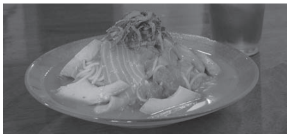
▲夏限定、サーモン&アボカドの冷製トマトスープスパゲッティ