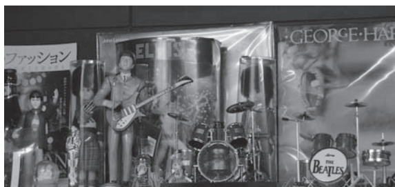
▲店内のグッズのほとんどはお客様からの寄贈だという