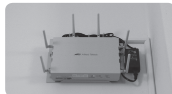
▲無線LANアクセスポイントの一例

接続方法やアクセスポイントの主な設置場所は、情報環境機構のホームページ ( http://www.iimc.kyoto-u.ac.jp/ja ) に記されています。また、最新の設置場所は学術情報メディアセンター等で配布されている広報誌『Info!』（旧『KUINSニュース』）に掲載されます。