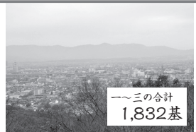
▲階段を20分ほど登ると、京都市南部が一望できる