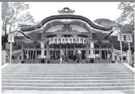
▲本殿でお参り。伏見稲荷大社は商売の神様として有名