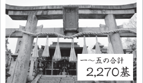
▲急な階段を登りつめた場所にある上ノ社。ここが最高峰