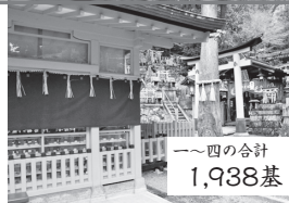
▲四ツ辻の少し先。「大山祭山上の儀」が行われる聖地