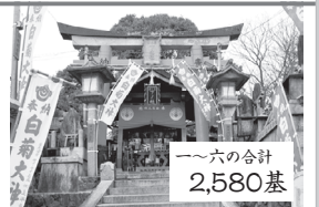
▲なだらかな峰をしばらく歩いたところにある下ノ社