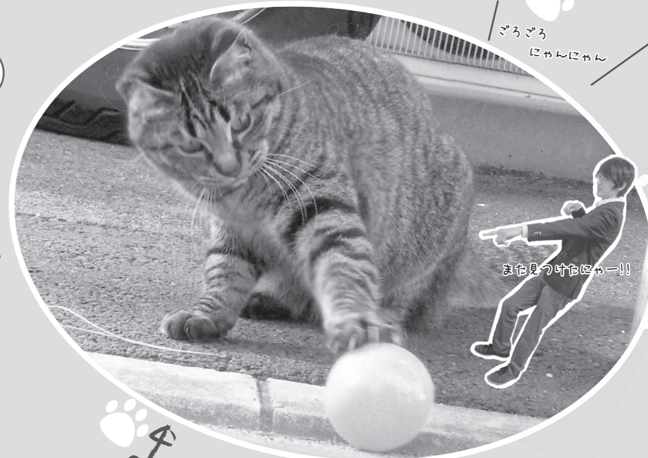
ごろごろにゃんにゃん

◀いきなり黒猫発見。正直寒いし面倒だったけど、この黒猫に免じてもう少し探してやろうかなあ。