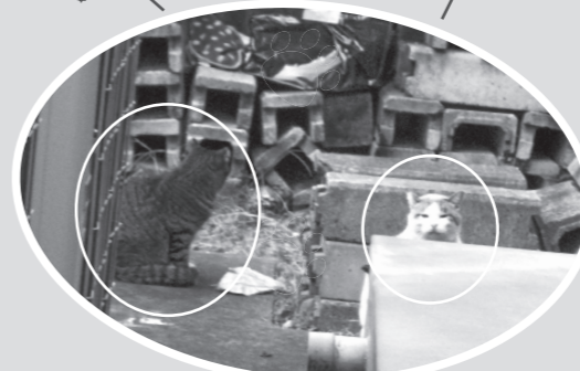
2匹一緒に仲良くにゃーん

▲意外と簡単におびき寄せられちゃったよ。ふふにゃあ……こんなかわいいの見せられたらもう我慢ならんっ、どんどん探すにゃああああああああ!!