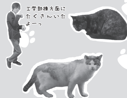
工学部棟方面にたくさんいたよーっ

▲意外と簡単におびき寄せられちゃったよ。ふふにゃあ……こんなかわいいの見せられたらもう我慢ならんっ、どんどん探すにゃああああああああ!!