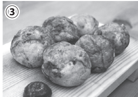
①売上No.1「たこ九条」(450円) ②具だくさん「たこイタリアン」(480円) ③店長おすすめキムチ入り!「たこヨンジユン」(470円)