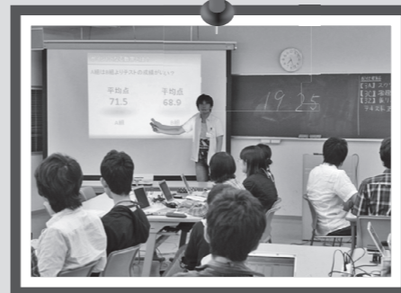
スタッフ2年目 Sさん

スタッフの仕事は大変なこともありますが、とてもやりがいがあり、達成感を感じます。さらに、レポートやプレゼンの資料の作成など、スタッフの仕事を通じて将来役に立つスキルが身につけていると思います。また、個性的な先輩方や友人、受講生との出会いも日々良い刺激になり、まさに成長のチャンスだと思います。