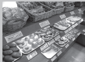
▲京大農園直送の野菜を使ったパンも販売している