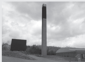
▲桂モニュメントの時計の下はディスプレイになっている