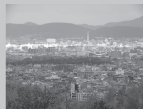
▲桂モニュメントのすぐ横のあたりが絶景ポイント

桂キャンパスは京都盆地の西にある西山のふもとに位置します。丘のような高さの場所なので、クラスター間を結ぶプロムナードからは京都の町を一望することができます。天気の良い日は京都タワーも見え、大変良い眺めです。