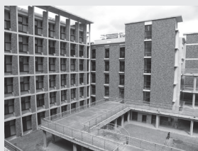
▲Aクラスターの様子。レンガの色は赤茶で統一されている

桂キャンパスの建物は統一感があり、また大型スクリーンや太陽光発電システムがあるなど吉田キャンパスとは違った雰囲気を醸し出しています。Bクラスターには桂キャンパスの象徴ともいえる「桂モニュメント」があります。