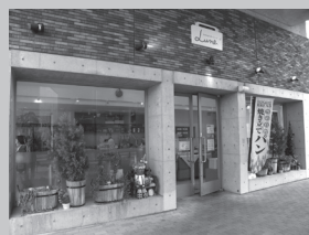
▲営業時間は平日・土曜は8～19時、日曜・祝日は8～18時

桂キャンパスAクラスターの「Lune リュネ 」では焼きたてのパンを販売しています。店内には飲食スペースもあるので、その場で焼きたてのパンを食べることもできます。季節の食材を使った新商品も毎月販売されています。