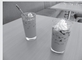
▲シナモンコーヒーなどオリジナルのコーヒーも飲める