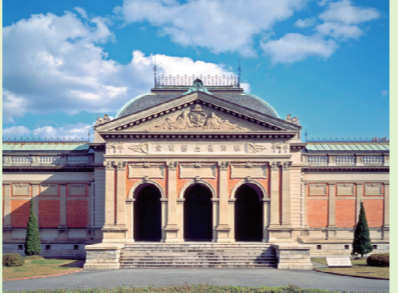
▲博物館らしい荘重なたたずまい、特別展示館(重要文化財 旧帝国京都博物館本館)。