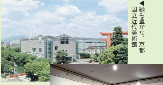
▲緑も豊かな、京都国立近代美術館