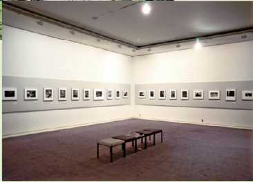
▶多くの逸品が並ぶコレクション展会場

茶道資料館 ちやどう 日本文化を体感する美術館。気負うことなくお点前を体験しよう