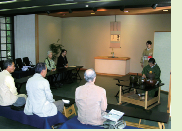
▶呈茶の光景。いすに座る立礼によるもので、敷居が高くない