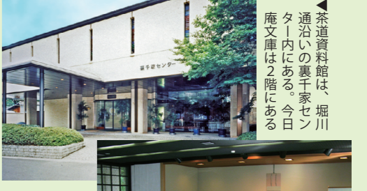
▲茶道資料館は、堀川通沿いの裏千家センター1階にある。今日庵文庫は2階にある