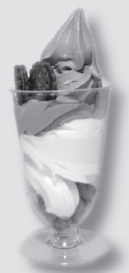
◀ルネの名物・パフェ。種類の多さは食堂ー