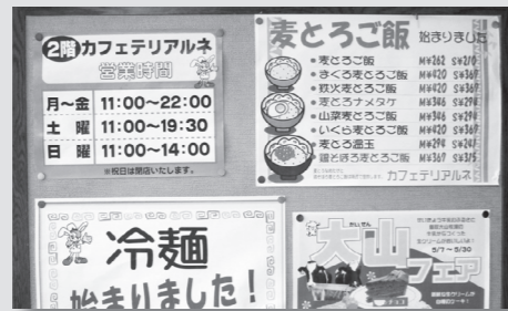
ルネの入り口にあるメニュー表▶

パフェをはじめメニューの多さを誇るカフェテリアルネ。品揃えだけでなく、学生の懐を応援する企画も多様です。例えば雨が降っている日には、いくつかのメニューが値引きされる「雨の日セール」が実施されます。雨で外出が億劫な時にこそ、訪れると良いでしょう。