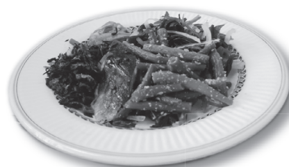
◀ASAPAの利用例。健康に配慮し、汁物と300gまでのおかずは定額