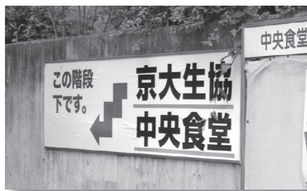
▶中央食堂の入り口看板