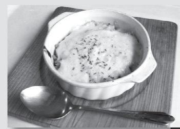
◀南部食堂オリジナルのドリア