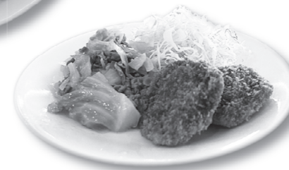
こちらの写真はメンチカツのセット▶