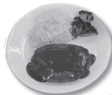
◀吉田食堂スピードランチの一例。写真はリングハンバーグ