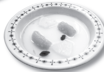
北部杏仁豆腐。これも北部オリジナル▶

北部食堂が支持される理由として、「お好みコーナー」の存在が挙げられます。このコーナーでは注文を受けてから目の前で調理してくれるので、できたての料理が食べられます。なかでも天津飯の評判は、他の追随を許さないといっても過言ではないでしょう。昼食時は混雑しているのに、夕食時に利用されてはいかがでしょうか。