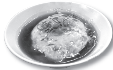
◀北部名物天津飯。卵は注文後に調理している