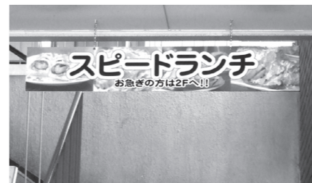
▶吉田食堂2階の看板

昼食時はいつも1・2回生たちでにぎわう吉田食堂。この2階では混雑を緩和するため、「スピードランチ」を提供しています。ただ待ち時間が短縮されるだけでなく、メニューは日替わりで提供されているため、毎日利用しても飽きません。もちろん、1皿でも栄養のバランスに配慮されたメニューが提供されています。