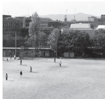
▲吉田グラウンド。安倍の最後の戦いがここで行われた。

話の流れとしては、現実離れたファンタジーに陥りかねないものである。しかしこの作品では、登場人物一人一人の思考や感情を巧みに表現し、恋愛やサークルに奔走する京大生たちの姿を等身大に描き出している。そのため地に足の付いた、リアルな物語が生まれている。