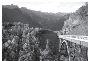
▲京都では味わえない雄大な自然美。紅葉の時期は場所により異なるので、事前のチェックが必要。

秋といえば紅葉ですが、飛騨高山の紅葉は京都で鑑賞するそれとは一味違います。最大の魅力は迫り来るような雄大さ、360度どこを見ても広がる鮮やかさです。美しく色付いた木々に囲まれながら静かな散策を試みれば、生で見る自然の美しさにきっと息を呑むことでしょう。ゆっくりと落ち着いて、秋の自然美を存分に楽しむにはもってこいです。