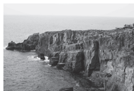
▲断崖絶壁の名所として知られる「三段壁」。南紀の海景が楽しめるスポットの一つである。

南紀白浜温泉は日本三古湯として数えられ、1300年余りの歴史を持つ由緒ある温泉です。外湯が海沿いに点在するので、外湯巡りを楽しむことができます。海沿いには、円月島、千畳敷や三段壁といった大海原が生み出した名所も存在するため、外湯を巡るかたわら、これらの名所を廻るのもよいでしょう。