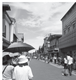
▲代表的な観光地である「おかげ横丁」江戸から明治にかけての伊勢の町並みが再現されている。

伊勢志摩の魅力は、観光地の多彩さです。伊勢神宮・おかげ横丁・志摩スペイン村など、非日常を楽しむことができる観光地が充実しています。アクセスには近鉄電車が便利で、上記の観光地への入場券・割引券と伊勢志摩への往復旅行券がセットとなった格安の特別切符「まわりゃんせ」が発売されています。