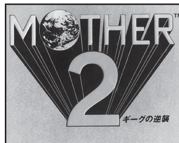
画像はスーパーファミコン版。現在はゲー ムボーイアドバンス版『MOTHER1+2』 の方が手に入りやすいだろう。

をする人もしない人も、まさに「おとな も子ども、おねーさんも」、ぜひ一度、 この不思議な世界を味わってみてもらい たい。 (TIGLA)