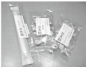
▲1位の京大飴。粒タイプの抹茶味が新発売された。