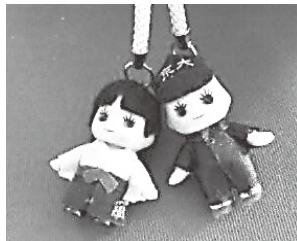
▲3位の京大キュービー。三高時代の学生服と袴を着たキュービーは、セットで買う人も多いとか。

「おいしい」「名前がユーモラス」「大勢におみやげとして配るのに便利」と好評の京大飴です。金太郎飴の京大版「なめんなよ『京大飴』」(315円)と、ソーダ味・抹茶味が楽しめる粒タイプ(各210円)の2種類があります。