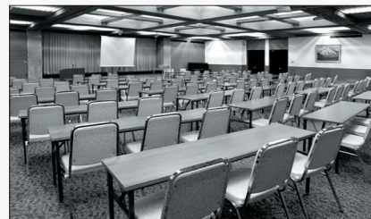
▲ 年間で約3000の講演会が行われる

18～200人収容可能な会議室が7室あり、会議の他にも、イベント・展示会場・会合・パーティーなど様々な用途がある。京大・学術関係で使用する際の料金は一般料金より安く、就職活動の時期以外は学生も簡単に予約ができる。パーティーの料理や値段の相談に対応しており、毎年利用している京大の団体もある。