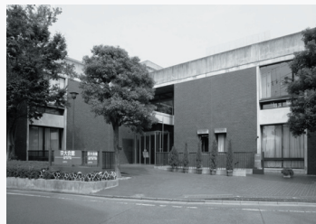
◀ 京大の時計台から自転車で約5分の距離

京大会館は1978年に京都大学創立70周年記念事業の一つとして建設された。京大の教職員・学生・卒業生をはじめ、一般の人も利用できる。京大会館には以下の施設がある。