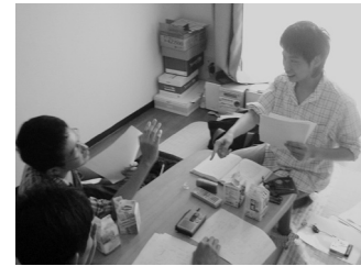
歓談の様子。全体を通して非常に白熱していた。

ここは大学近くの某所。ここにお風呂をこよなく愛する3人がやってきた。歓談が始まる前、彼らは一様に笑顔で振舞い和やかな空気が流れていた。しかし歓談が始まると……。一体どんな歓談になったのだろうか? その一部始終をご覧ください。