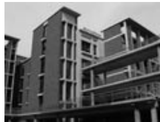
Aクラスター研究棟