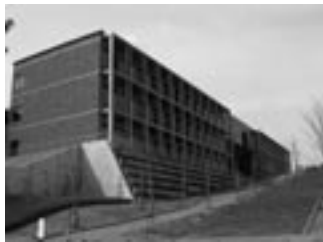
Bクラスター事務管理棟

キャンパス内に関しては、Aクラスターは化学系、電気系の研究棟、環境管理やエネルギー管理を行うEMセンター棟、およびAクラスター事務棟が完成し、教育・研究を開始しています。現在、国際融合創造センターなどが入る予定のローム記念館が建設中です。