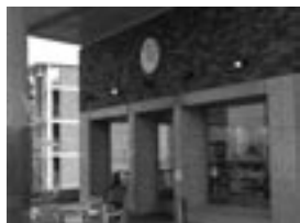
ベーカリーカフェ「つきのき」