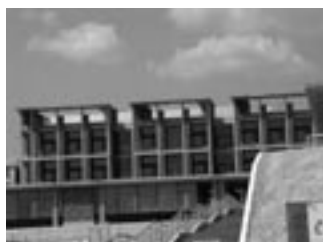
Cクラスター建築系研究棟