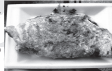
▼阪神百貨店のいか焼き 170円

地元の人には有名でありながら、あまり全国に知られていないいか焼き。いかの丸焼きではなく、小麦粉とこま切れのいかを混ぜて鉄板で焼いたもので、そのまま食べても、ソースをかけてもおいしい。阪神百貨店梅田店地下1階のいか焼きコーナーでは、いつも長蛇の列ができていますが、並ぶだけの価値がある一品だ。