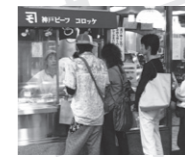
▲神戸「コロッケ」本店

神戸を知るなら一度は食べたいのが、南京町「老祥記」の豚まん、神戸コロッケ。「老祥記」は大正4年に開業した日本初の豚まん専門店、麺で発酵させた独特の食感の皮としょうゆに漬けた具の調和が人気を集めている。毎日開店直後から行列ができる。また、神戸コロッケ本店には、素材にこだわった昔ながらの味を求めて多くの人が訪れる。