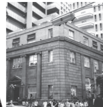
▲旧居留地に残る洋風建築物