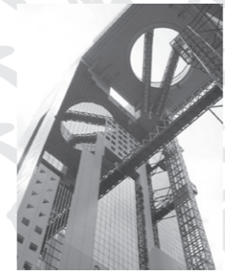
▼ウエストタワーと空中庭園

今年でちょうどオープン10周年を迎えるスカイビルは2本のタワーと展望台「空中庭園」が連結されて一体となった巨大吹き抜け空間が特徴。地上170mの屋上展望台からは、回廊に沿ってぐるりと一周、大阪平野が眺望できる。