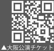
▲大阪公演チケット

まずは演奏会へ行く予定をササッと作ってしまおう。2026年1月15日（木）の大阪公演、1月17日（土）の京都公演の、都合の良い方を選んで購入しよう。両日18:00開場、19:00開演となっている。 チケット購入の際に席選んで悩んでしまうかもしれないが、京大オケの公式Instagramで各楽器ごとに「おすすめ席」が紹介されているので、そちらも参考にされたし。