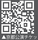
▲京都公演チケット